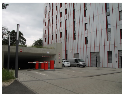
Be- und Entladezone / Zufahrt Tiefgarage