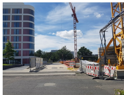
Zufahrt für Fahrzeuge über 3,5 Tonnen / Einfahrt De-Saint-Exupéry-Straße